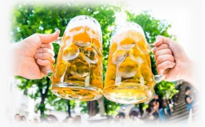
HANDEL UND GASTRONOMIE