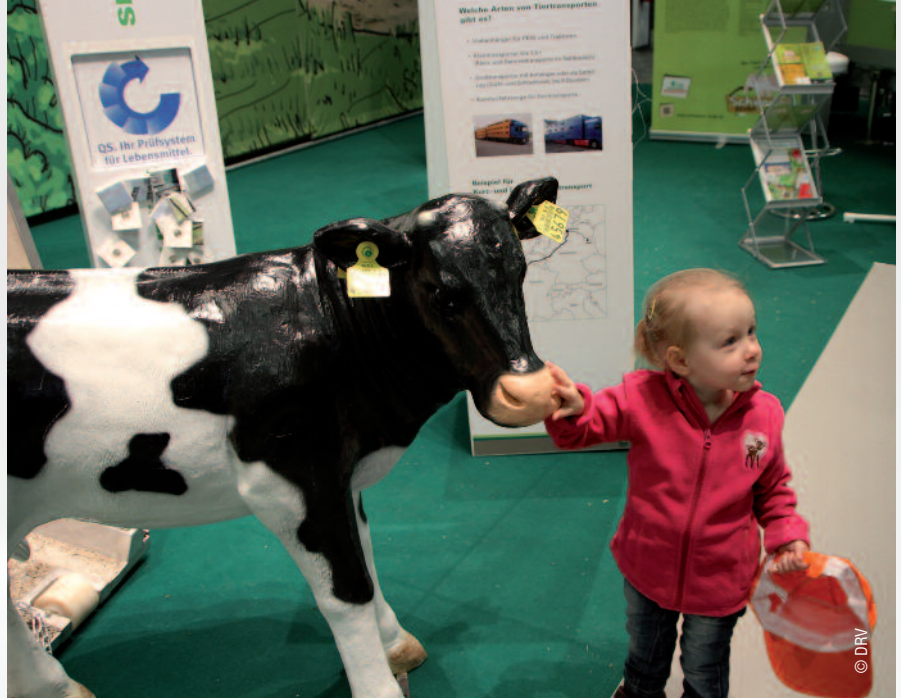
Zumindest für Kinder stehen hinter dem Thema Milch wegen der puzigen Kühe große Emotionen: Milch-Verbrauchernachwuchs auf der Internationalen Grünen Woche 2013