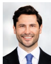
Verfasst von Leonard Kluck

Durch einen konsequenten Fokus auf die gesamte HR-Wertschöpfungskette wird die Entstehung hochmotivierter High-Performance-Vertriebsteams gefördert, die durch Kundennähe und Umsatzorientierung entscheidend zum Unternehmenserfolg beitragen. ■