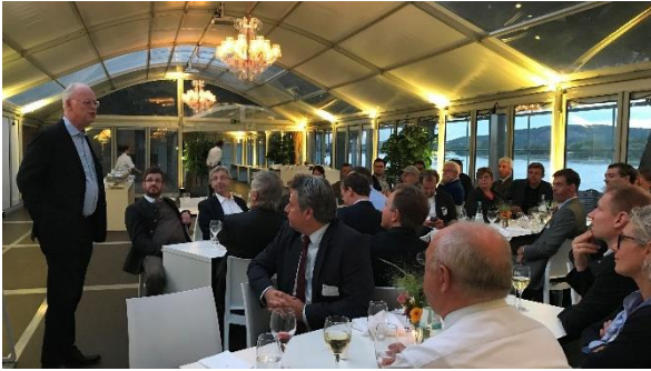
Bundesminister a.D. Rudolf Scharping / RSBK AG, Frankfurt

Die angeregte Diskussion mit den Referenten setzte sich beim Netzwerkabend im Kastaniengarten des Rheinhotels Dreesen fort. Nach einer tollen Auswahl an Vorspeisen und Hauptgerichten kam dann der Dinnerspeaker Rudolf Scharping zu Wort. Niemand vermisste die Nachspeise, weil der ehemalige Bundesverteidigungsminister und SPD-Chef sehr lebhaft über ein mit vielen Anekdoten angereichertes Thema sprach. Schließlich führt Scharping ein Beratungsunternehmen, das sich vor allem mit der Strategie- und Geschäftsentwicklung von Unternehmen und Institutionen in China beschäftigt.