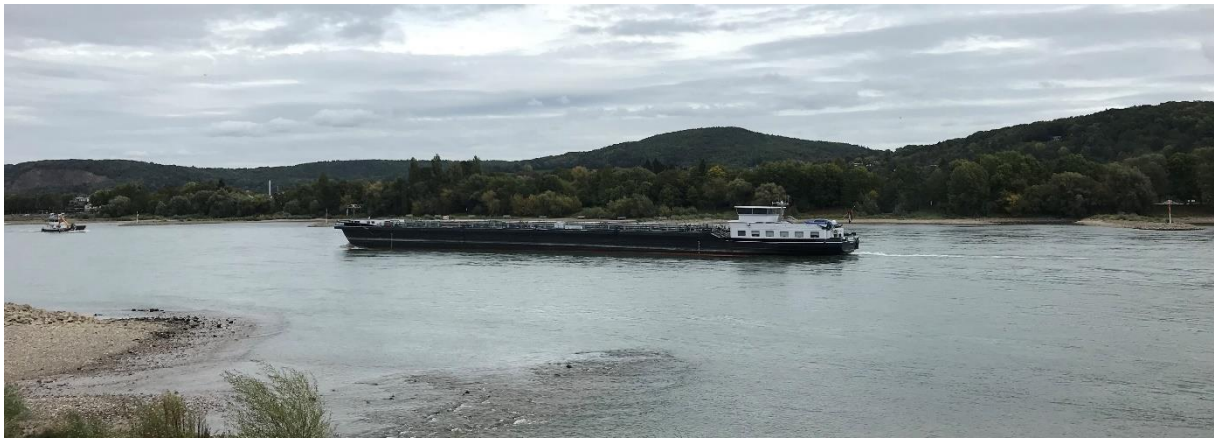
Das Rheinhotel Dreesen bot als Tagungshotel ein perfektes Ambiente